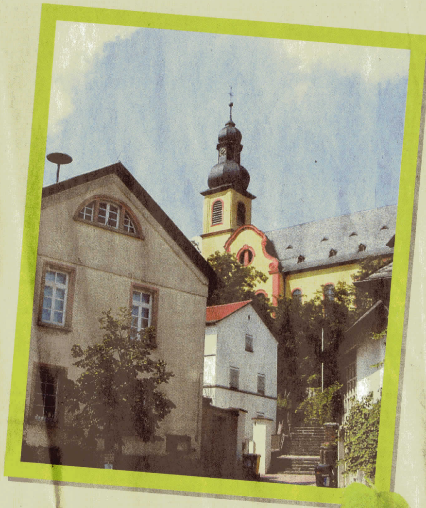
Die Kirchweih ist der Ursprung der Kerb. Am Wochenende lädt die Gemeinde Nackenheim zu diesem Fest ein.